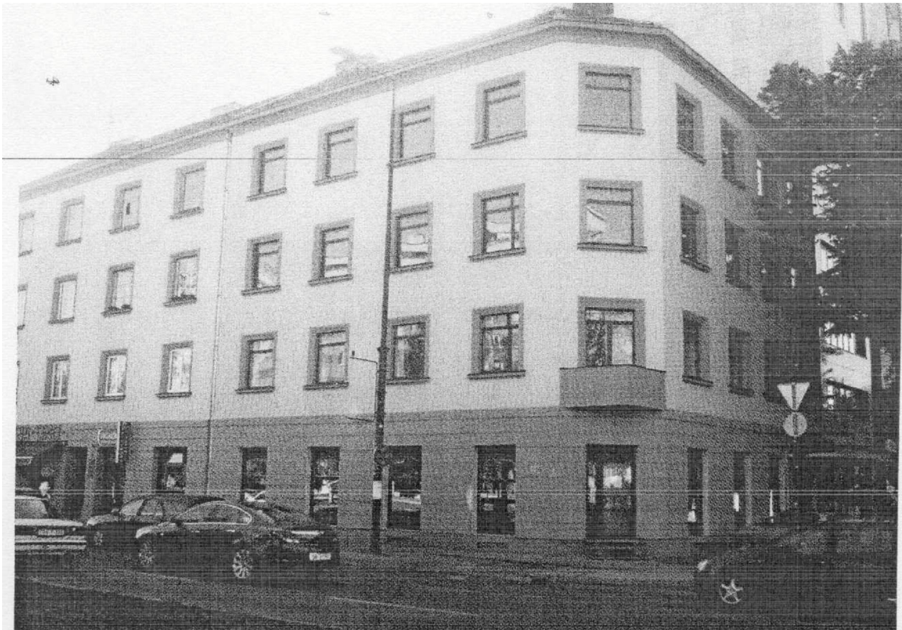
sl. 2 - Sjeverna fasada sa pogledom na ulaz u poslovne prostorije na prizemlju